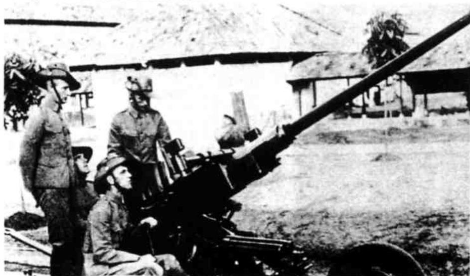
Oefening KNIL-miliciens met 40 mm luchtdeelgeschut.

Een officier, begeleid door iemand met een witte vlag, die met het bericht naar de batterij was gestuurd, was onverrichte zaken terug-